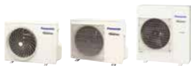
CU-2E12SBE / CU-2E15SBE / CU-2E18SBE / CU-3E18PBE / CU-3E23SBE / CU-4E23PBE / CU-4E27PBE / CU-5E34PBE

Conforme à la RT2012 ! Multi split 2,3,4 et 5 sorties : possibilité de bloquer le groupe en mode chaud*